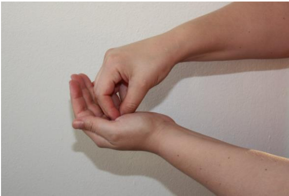
1. Upota sormenpäät kämmenpohjaan otettuun huuhteliuokseen.

Pese kätesi, kun ne ovat näkyvästi likaantuneet. Muutoin käytä käsihuhdetta. Annostele käsihuhdetta runsaasti kuiville käsille (noin 3 – 5ml). Kokonaiskesto 20 – 30 sekuntia.