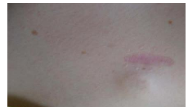
Kuva 4 Nappi ilman neulaa