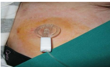
Kuva 2 Neula napissa

Kotiin lähtiessäsi nappiin laitetaan hepariinia, joka pitää sen toimivana. Yleensä neula poistetaan ennen kotiutumista (Kuva 4).