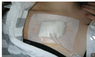
Kuva 3 Neula kiinnitettynä teipillä