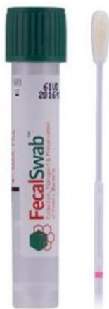
Kuva 1b. FecalSwab