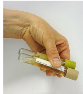
Kuva 3. Putkien sekoittaminen 5-10 kertaa

Tuo näyteputket laboratorioon mahdollisimman nopeasti näytteenantopäivän aikana.