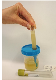
Kuva 2. Putkien täyttäminen