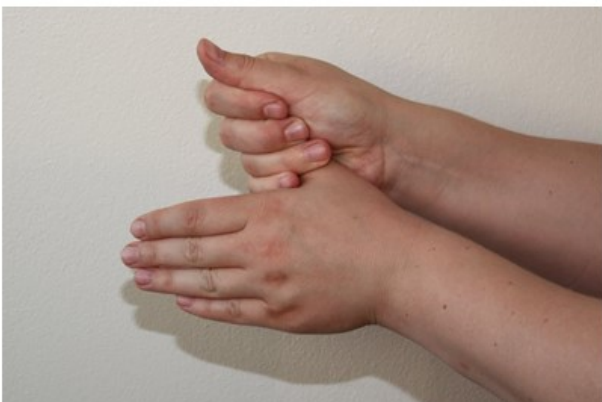
5. Huomioi molemmat peukalot.