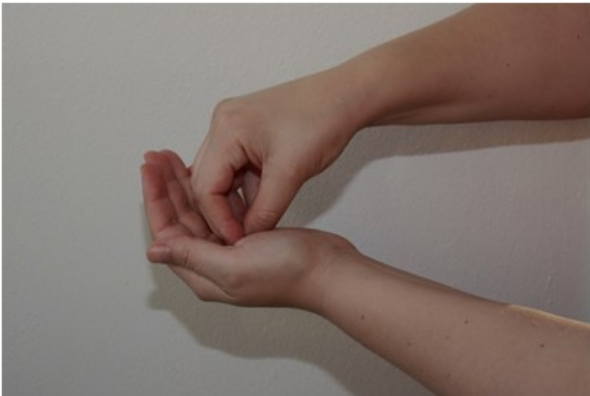
1. Upota sormenpäät kämmenpohjaan otettuun huuhteliuokseen.

Pese kätesi, kun ne ovat näkyvästi likaantuneet. Muutoin käytä käsihuhdetta. Annostele käsihuhdetta runsaasti kuiville käsille (noin 3 – 5ml). Kokonaiskesto 20 – 30 sekuntia.