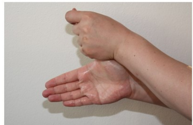
6. Hiero käsiä, kunnes ne ovat kuivat.