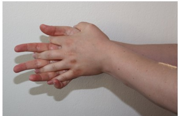
4. Huomioi sormien välit.