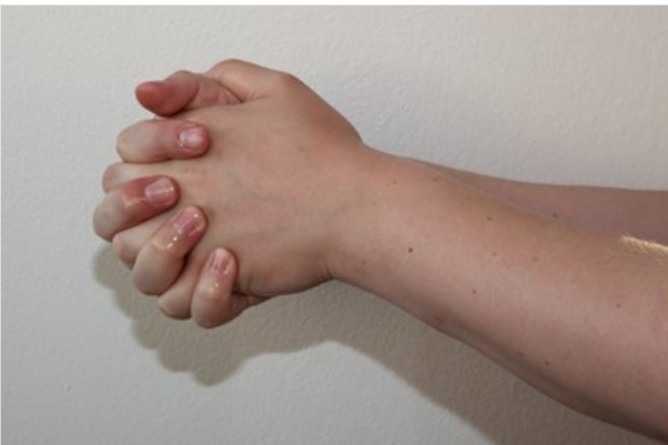
3. Levitä huuhte joka puolelle käsiä.