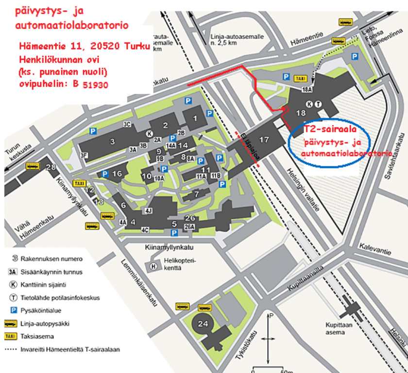
Tyks Kantasairaalan aluekartta.