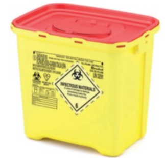
CS 22 PLUS