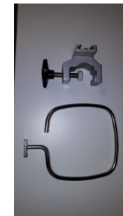
Telinesarja kärryn runkoon ja Euro-kiskoon CS 7- sarjan astialle