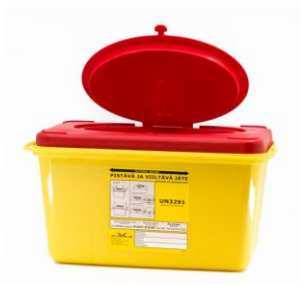
SafeBOX Prime 4l