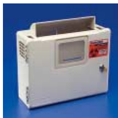
Sharpsafe automaattisella heilurikannella 4,6 l + lukittava seinäteline