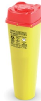
CS 7 PLUS