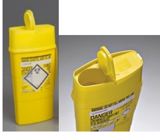
Sharpsafe 0,6 l, iso suuaukko