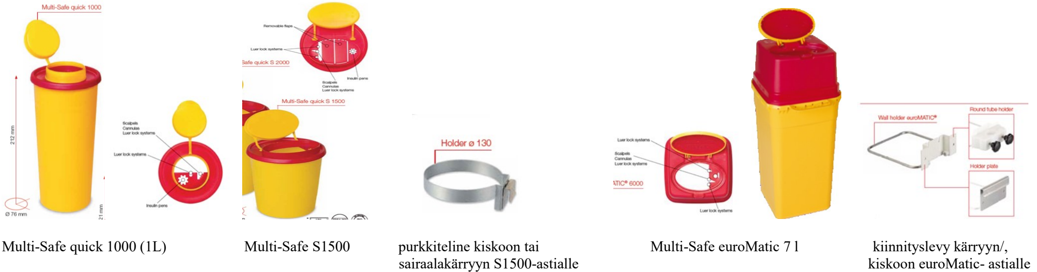
Multi-Safe quick 1000 (1L)

SARSTEDTIN SOPIMUSTUOTEET: ( https://www.sarstedt.com/en/products/diagnostic/multi-safe/boxes/ )