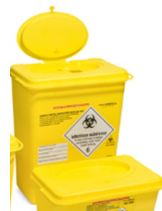
SafeBOX Prime 6l