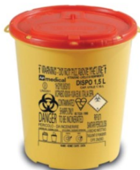
DISPO 1,5 l