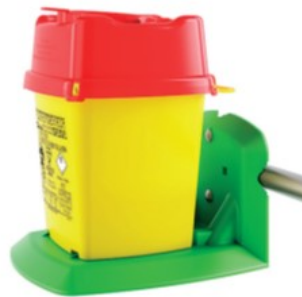
TELIN DISPO 1,5 ja 3 L- astioille