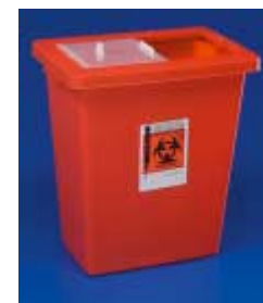
Sharpsafe 67 l liukukannella + pyörällinen lattiateline (jalkapoljin aktivoi liukukannen)