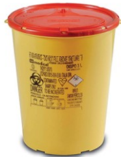
DISPO 3 l