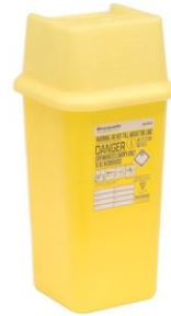
Sharpsafe 7 l + lankateline- astialle