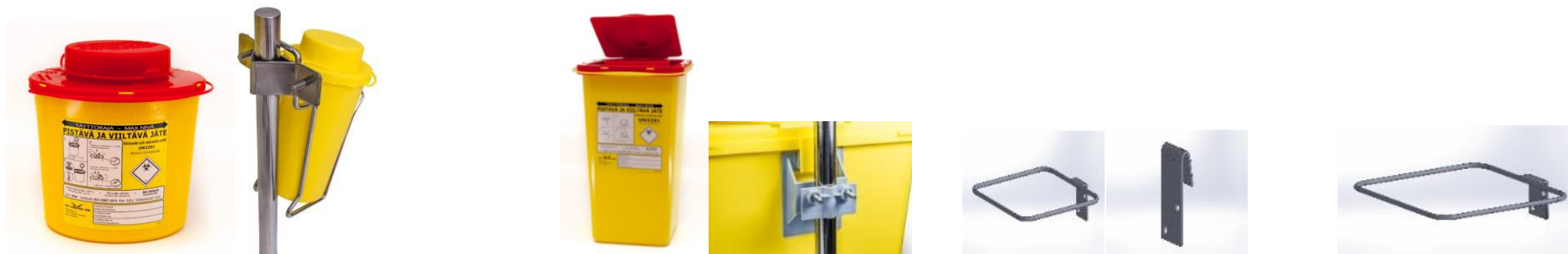
SafeBOX Vital 1,5 l ja kääryteline Vital-astialle

VESTEKIN SOPIMUSTUOTTEET: (kuvat https://www.safebox.eu/standard-solutions/overview/ )