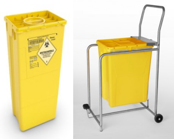
EVO 60 DUO + pyörällinen teline astialle

BERNERIN SOPIMUSTUOTTEET: (kuvat https://www.berner.fi/pro/wp-content/uploads/2018/02/AP-Medical-S%C3%A4rm%C3%A4isi%C3%A4teastiat-esite-WEB.pdf )