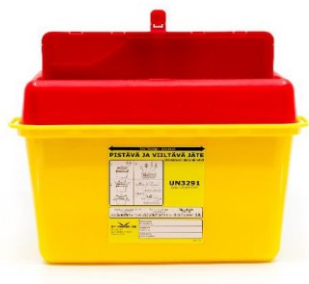
SafeBOX Guardian 4l ja niihin sopiva seinäteline