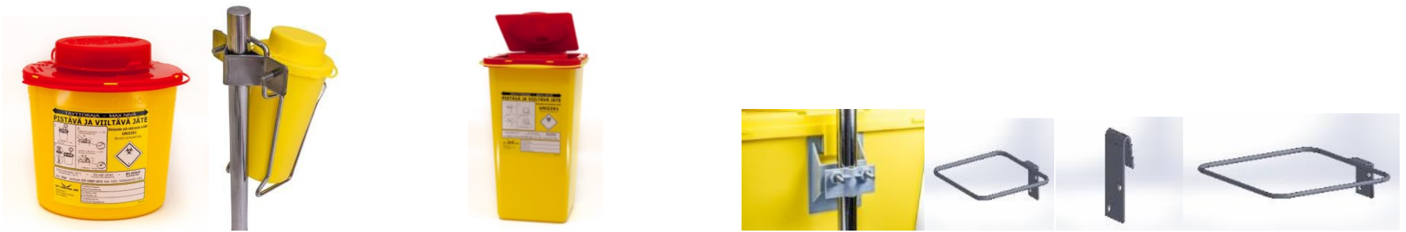
SafeBOX Vital 1,5 l ja kärkyteline Vital-astialle

VESTEKIN SOPIMUSTUOTTEET: (kuvat https://www.safebox.eu/standard-solutions/overview/ )