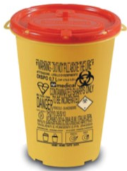
DISPO 0,7 l