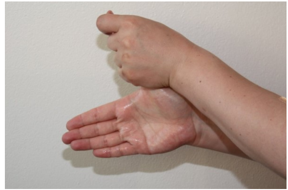
6. Massera händerna tills de är torra.