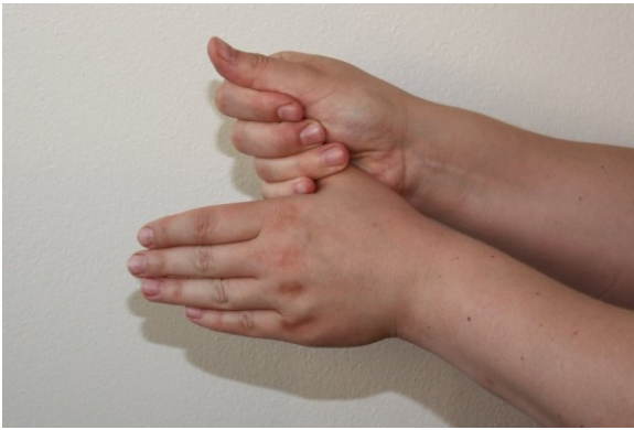
5. Observera båda tummarna.