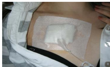
Bild 3. Nål fäst med tejp