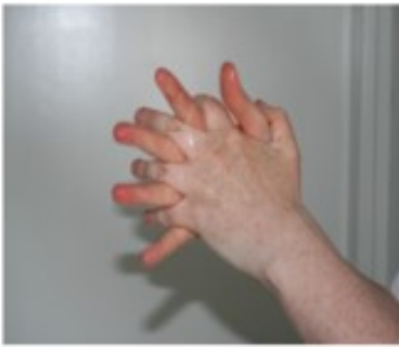
1. Desinfioi kädet Anna huuhteen kuivua