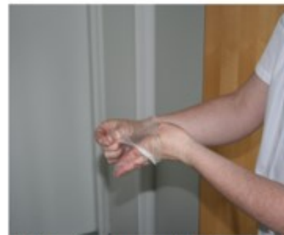
6. Poista suojakäsineet. Desinfioi kädet.