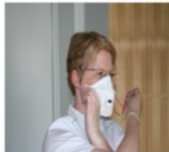
4. Riisu suojain rauhallisesti ja hallitusti.