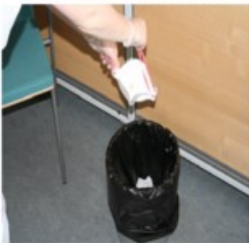
5. Laita käytetty hengityssuojain suoraan kannelliseen roska-astiaan.