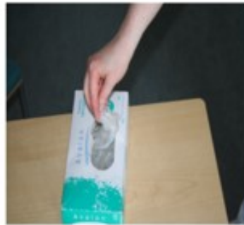
2. Pue suojakäsineet